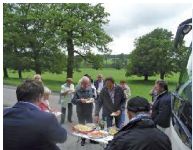
DAS PICKNICK mit regionalen Spezialitäten am Bus kam sehr gut an.