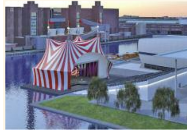
Das Showzelt in der Autostadt an der Lagune.