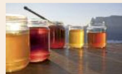
Honig in allen Schattierungen und Geschmacksnuancen aus Südtirol.

Die nördlichste Region Italiens ist landwirtschaftlich imposant. Die vielfältige Pflanzenwelt bietet ideale Voraussetzungen für die Honigbiene, deren Bienenstöcke sowohl im Tal als auch auf den Südtiroler Almen stehen können. Das schlägt sich in Farbe und Geschmack ihres Honigs nieder. In Südtirol gibt es insgesamt 6.000 Bienenvölker, die von 150 Imkern betreut werden und jährlich rund 90.000 Kilogramm Honig mit Qua-