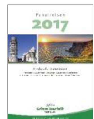
Das Machwerk von GTW.

programm „Die große Weinstraße Norditaliens“, eine Kombinations-Themenreise zur Landesgartenschau Kremsmünster und Martin Luther „Dreiklang der Gärten und 500 Jahre Reformation“ oder Reisen zur Internationalen Gartenausstellung (IGA) in Berlin, die vom 13.04. bis 15.10.2017 stattfindet. Zu den Destinationen, die von der GTW besonders ausgebaut und erweitert wurden, gehören Italien, dabei speziell die Regionen Apulien und Sizilien, Portugal mit Porto und den Azoren sowie Frankreich mit Côte d’Azur, Provence und Camargue. Auch das Preisniveau im Vergleich zum Vorjahr stellt sich positiv dar: „Reisen in die Schweiz und nach Großbritannien