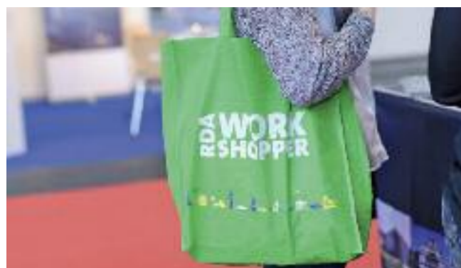
ZEIT für Workshoper...

RDA hat Studenten zum Messebesuch nach Köln eingeladen