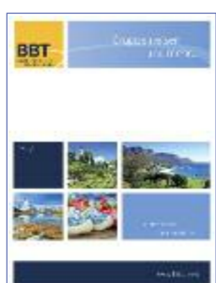
Der neue Katalog von BBT.

Soest. „Gemeinsam Ziele erreichen“... unter diesem Leitmotiv präsentiert der Soester Paketreiseveranstalter auf dem RDA-Workshop sein Programm 2017. BBT präsentiert sich wie im Vorjahr gemeinsam mit Schlienz „Partner für exklusive Flussreisen“. Am Mittwoch, 2. Messetag, lädt BBT ab ca. 17:00 Uhr zum traditionellen „Meet & Snack“ an seinen Stand. Mit der Eröffnung der Kieler Zweigniederlassung hat das BBT Team im Bereich Gruppenflugreisen erhebliche Verstärkung bekommen. Hier kümmern sich Kenner um Anfragen für Afrika, den Orient, Zypern und die Iberische Halbinsel. Wie wäre es z.B. mit der Traumreise ans Kap „Südafrika erleben“ oder einer Flugreise nach Namibia. Neu im Programm die 9-