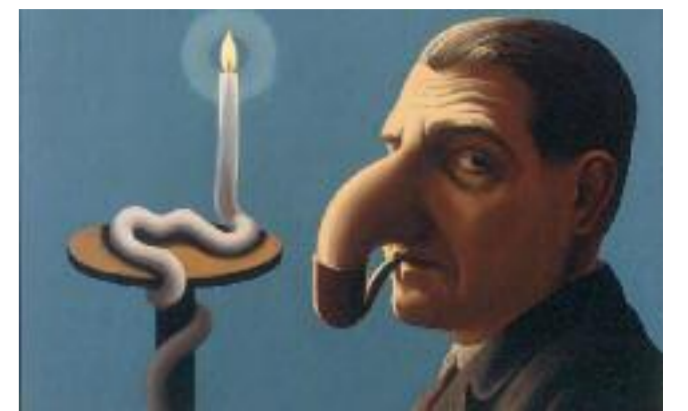
Magritte: La lampe philosophique 1936.

Frankfurt. Die Schirn Kunsthalle Frankfurt widmet dem Magier der „verrätselten“ Bilder René Magritte (1898–1967) die erste große Ausstellung im Jahr 2017. Für seine außergewöhnlichen künstlerischen Strategien suchte der belgische Surrealist Magritte die Nähe zur Philosophie, die ihm die Impulse für den komplexen Charakter seiner Bilder lieferte. So suchte der Künstler den engen Austausch mit Heidegger-Spezialisten ebenso wie mit dem großen Michel Foucault. In diesen Dialogen wird Magrittes anhaltende Beschäftigung mit Fragen