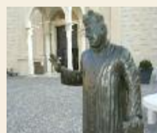
Die Statue in Brescello erinnert an Don Camillo.

Michelangelo International Travel mit besonderer Reise