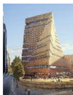
Die neue „Tate Modern“.

Hotels & More empfiehlt den Reisenden den Besuch der Tate Modern mit