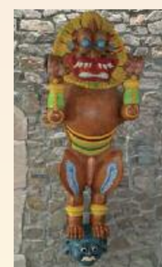
KULTEFIGUR aus Nepal.

besucht – eine Zahl, auf die auch ein Reinhold Messner stolz ist – vor allem, weil seine Widersacher dies ihm und seinen Projekten nie zugetraut hätten. Doch der „Museumsmacher“ Messner will sich auf diesen Lorbeeren seines „15. Achtausenders“, wie er das MMM-Projekt nennt, nicht ausruhen. Ihn drängt es zu neuen Taten, wie wir gleich erfahren ... ■ Herr Messner, Sie arbeiten an einem neuen Projekt? Reinhold Messner: „Ja, ich starte jetzt mit eigenen Bergfilmen. Bisher habe ich 6 Leben geführt, damit beginnt jetzt mein siebtes. Ich habe in jungen Jahren das Leben eines Felskletterers gelebt, dann das eines alpinen Bergsteigers, gefolgt von dem eines Abenteurers. Danach habe ich 15 Jahre lang wissenschaftlich gearbeitet und Bergvölker studiert. Anschließend gibt Einbildung in die Lebensweise der Bewohner der wichtigsten Bergregionen zwischen Alpen und Himalaya, Anden und Afrika – ein aufregender Rundgang durch 5 Kontinente sozusagen. Im sechsten MMM, dem Ortles Museum in Suldens am Ortler – auf 1.900 m Höhe unterirdisch im Berg angelegt – dreht sich alles um das Eis. Dazu der Gasthof „Yak und Yeti“ mit Yakzucht und Biohof – für mich einer der schönsten Plätze der Welt.“ ■ Wir sind hier im Firmian, Hauptsitz ihrer 6 Museen. Wie kamen Sie auf die Idee, Museen dieser ungewöhnlichen Art aufzubauen und daraus letztlich einen Komplex zu schaffen, der heute als größtes Bergmuseum der Welt gilt?