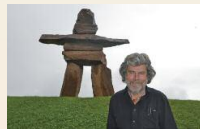
STEINERNER WEGWEISER: Reinhold Messner vor einem Inukusk der Eskimos.

(Iop) Reinhold Messner wird am 5. Juli beim RDA-Workshop in Köln auf dem TrendForum auftreten und über seine 6 MMM Messner Mountain Museen als hochinteressante Busziele an verschiedenen Orten Südtirols berichten. Busreiseveranstalter sollten sich diesen Vortrag (um die Mittagszeit) keinesfalls entgehen lassen!