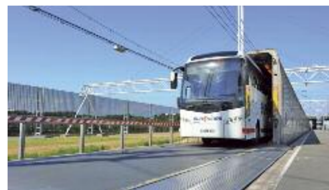
Einfach und bequem: Ein Reisebus bei der Ausfahrt aus dem Waggon von Le Shuttle.

Schnellste Art, Großbritannien mit dem Reisebus zu erreichen