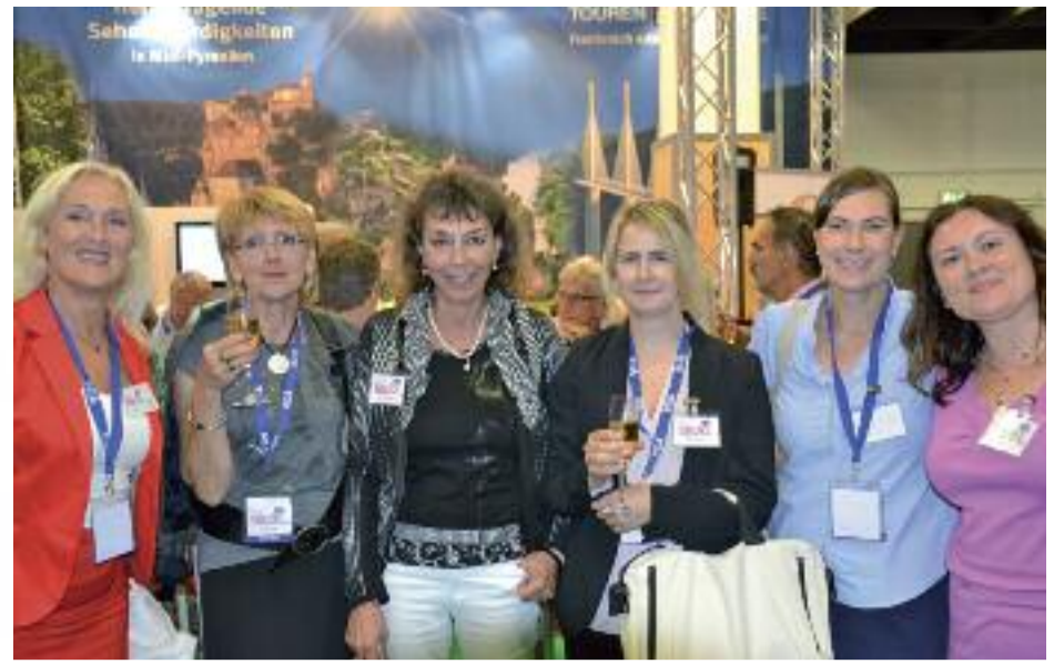
Unser Team freut sich auf Ihren Besuch. Herzlich willkommen am EuroBus-Stand. Halle 6/Stand L 03.