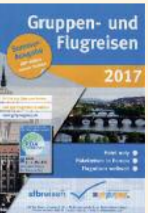
Der neue Katalog.