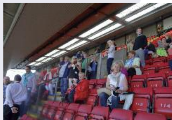
LIVE IM STADION: Stippvisite beim FC Liverpool.