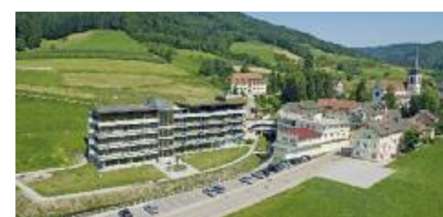
Das Morada Hotel Nordrach liegt am Waldestrand inmitten der Natur.

Morada Hotel Nordrach im Luftkurort Nordrach