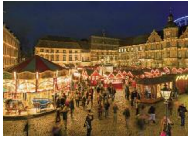
Der Marktplatz zur Weihnachtszeit.

In der Vorweihnachtszeit erstrahlt die Innenstadt Düsseldorfs in festlicher Atmosphäre. Vom 17. November bis 23. Dezember wird der Weihnachtsmarkt an zahlreichen Orten in der Innenstadt inszeniert: Vor dem Düsseldorfer Rathaus lädt der historische anmutende Handwerkermarkt ein, bei einem Glas Glühwein Kunsthandwerk zu entdecken und zu bestaunen. „Himmlische Atmosphäre“ mit Engelsfiguren bietet der „Engelchenmarkt“ am Heinrich-Heine-Platz. Weitere liebevoll gestaltete Märkte wie der idyllisch im Innenhof des Wilhelm-Marx-Hauses gelegene „Sternchenmarkt“ am Stadtrückchen oder die alte Düsseldorfer Bürgerhäuser erinnernden Hütten auf der Flinger Straße inmitten der Altstadt bieten