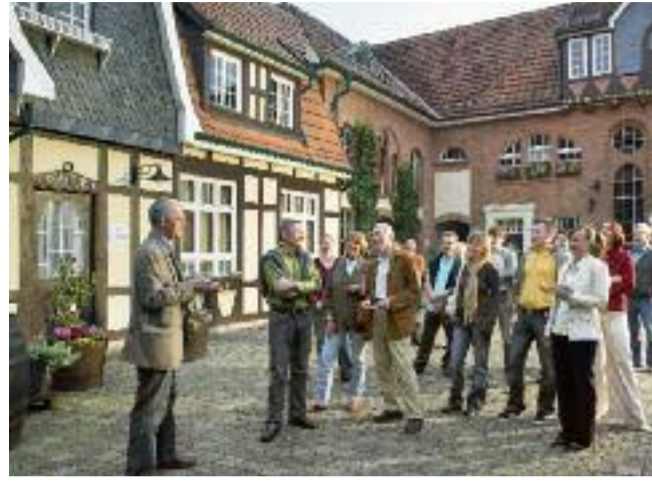
Gut gelaunte Besuchergruppe im Innenhof der Brennerei.

Die Echter Nordhäuser Traditionsbrennerei ist das bedeutendste Museum der deutschen Kornbrenntradition. Mitten im Herzen der Stadt Nordhausen gelegen hat sich das einzigartige Museum in den letzten Jahren stetig zu einem echten Besuchermagneten und kulturellen Zentrum entwickelt. Mit ihrem unvergleichlichen Charakter – einer stimmungsvollen Mischung aus denkmalgeschützten Gebäudeensemble und modernem Erlebnismuseum – ist die Echter Nordhäuser Traditionsbrennerei zu einem attraktiven Anziehungspunkt in Thüringen für Reisende aus ganz Deutschland geworden. Die Echter Nordhäuser Traditionsbrennerei setzt der Jahrhunderte alten Korn-Brennkunst in Nord-