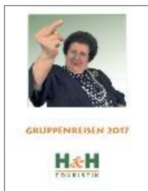
Das frische Titelbild Gruppenreisen 2017.