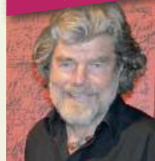
Bergsteiger-Ikone und Museumsgründer Reinhold Messner.

Reinhold Messner beim RDA: Dienstag, 5.7., 14 bis 14.45 Uhr, TrendForum