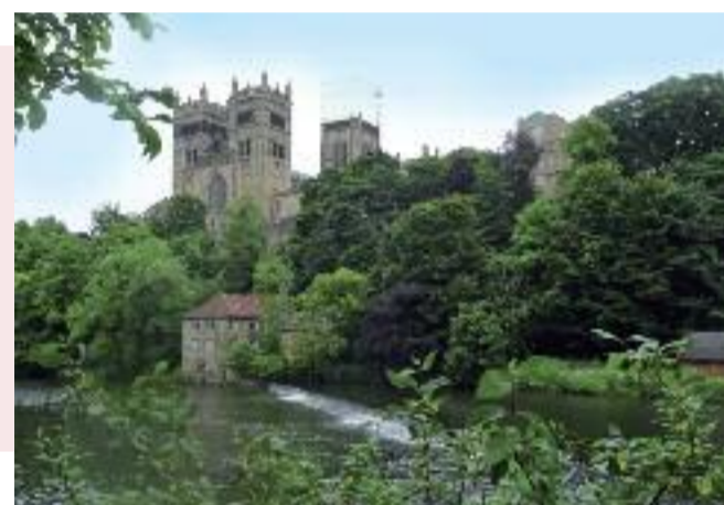
Die Kathedrale von Durham.