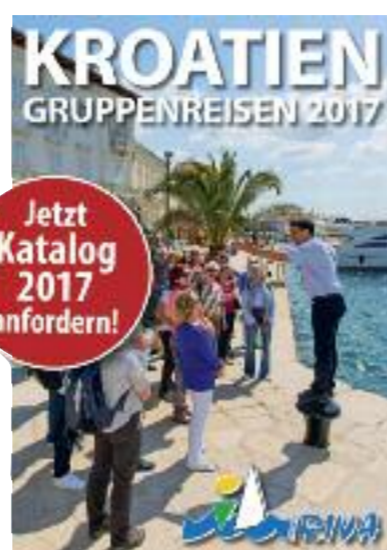
Der neue Katalog von I.D. Riva Tours.

I.D. Riva Tours mit neuen Gruppenreisen 2017