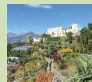
Warme Farben und spektakuläre Ausblicke erwarten die Besucher im Herbst.

Das Paket „Gärten & Wein“ bietet eine 360° Reise durch die einzigartige Südtiroler Weingeschichte! Nach einem Wein-Streifzug durch die Gärten geht es zur größten und wohl auch ältesten Rebe der Welt, der „Versoaln“-Rebe, bei Castel Katzenzungen in Prissian. Information: Tel. +39 0473 255 600 www.trauttmansdorff.it