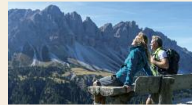
Wandern – und den Ausblick auf ein grandioses Bergpanorama genießen.

netz die Orte und Menschen im Tal und auf dem Berg seit Jahrtausenden miteinander verbindet. Heute treffen hier unterschiedliche Landschaften, Kulturen und Lebensarten reizevoll aufeinander, mischen sich alpine Bodenständigkeit mit mediterranem „Dolce Vita“.