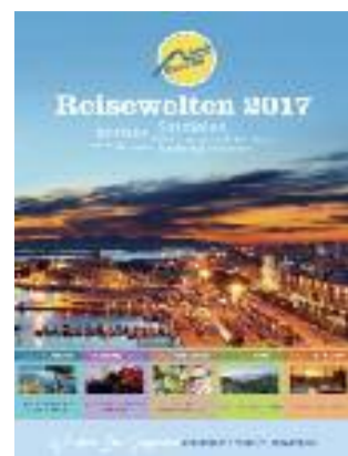
Titelbild der „Reisewelten“.

Darmstadt. Mehr als 140 Gruppenreisen auf Korsika, Sardinien und Sizilien sowie in Andorra und anderen ausgewählten Regionen