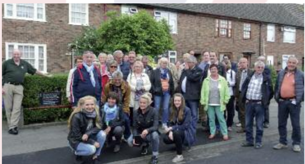
Vor dem Geburtshaus von Paul McCartney in Liverpool.