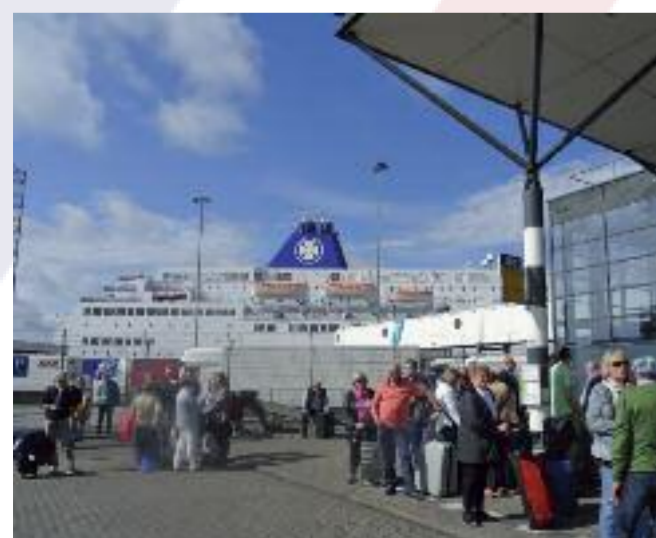
HEIMREISE: Ankunft in Amsterdam vor der DFDS Fähre.