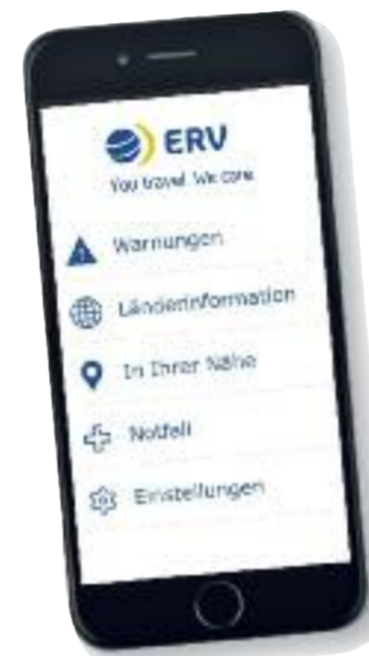
Die neue ERV-App für das Handy.

Service GmbH) auf dem RDA-Workshop vom 5.-7. Juli 2016. Am gemeinsamen Stand E41 in Halle 9