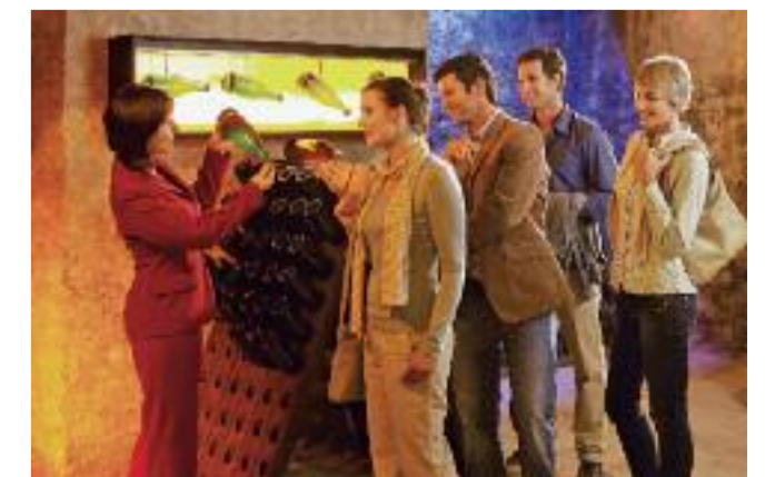
Viel Wissenswertes erfahren die Besucher während einer Führung.

Präsent im Shop eingelöst werden. www.rotkaeppchen.de