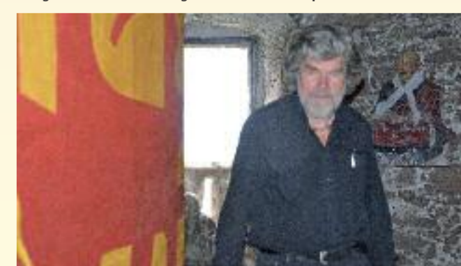
BESINNUNG: Reinhold Messner beim Drehen der großen Gebetsmühle aus Tibet.

isen und unsere Möglichkeiten zu spüren“. ■ Wie wichtig ist dabei der Teamedanke und wie kann man dies auf unsere Zivilisationswelt anwenden? Themen, über die Sie auch bei Ihren Vorträgen über Leadership oder Risk-Management berichten? Messner: „Vertrauen in das Team ist sehr wichtig, nicht nur in Extremsituationen. Bei meinen Vorträgen sage ich den Zuhörern nicht, ich weiß, wie es geht. Sondern ich erzähle so, dass jeder seine eigenen Schlüsse ziehen kann. Ich schreibe gerade an einem neuen Buch über eine Gruppe Männer in einer Extremsituation in der Wildnis. Darin geht es auch um Leadership und die Rolle einer starken Person hinter den beiden formalen Leadern, die nach deren Vorgesagten in eine Art natürliche Führungsposition hineinwächst und zum Retter in der Not wird.“ ■ Woher nehmen Sie eigentlich die Energie für all Ihre Tätigkeiten? Kraft durch Meditation oder eine besondere Lebensweise? Messner: „Mein Streben war es immer, tadellos zu leben und mich meinem Alter entsprechend zu verhalten und zu ernähren. Bevor ich von grüner Landwirtschaft geredet