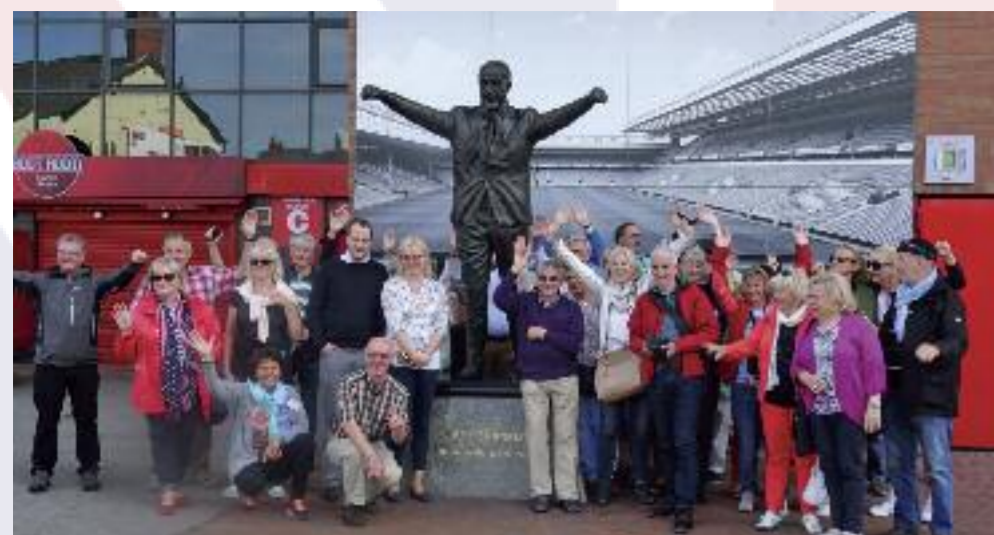
BEIM FC LIVERPOOL an der Anfield Road: Die Gruppe vor der Statue der Fußball-Legende Bill Shankly.