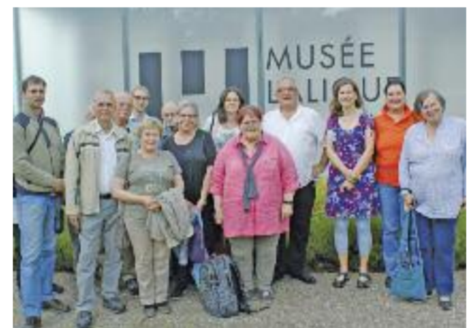
Gruppenfoto von der Inforeise Elsass.

Im Anschluss an den Atout France Workshop „La Boutique France“ gingen 15 Bus- und Gruppenreise-