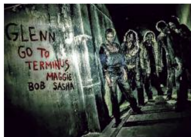
Der Horror schleicht sich an...