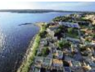
Belambra-Resort-Hotels in Balaruc-les-Bains/Montpellier.

vorgestellt, der Clubanlagen und Hotels bietet, die an Frankreich schönsten Stränden, Regionen und Landschaften liegen. Dazu gibt es einen neuen Sonderkatalog „Belambra Hotelclubs 2017“, dessen Angebote ausschließlich über stb-reisen mit Top-Sonderpreisen vermarktet werden und die nur über Get Your Group buchbar sind. Damit setzt Get Your Group neue Maßstäbe im Preisgefüge für Frankreich-Reisen und erschließt seinen Kunden ganz neue Geschäftsfelder. Darüber hinaus erlaubt ein neues Get Your Group Online-Tool Agenturen und Hotelketten, zentral mehrere Hotels einzustellen und