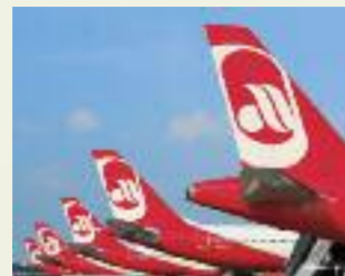
Neue Flugtermine über SRG.

Über 80 Termine für 2016 und 2017 sind für eine Vielzahl an Destinationen verfügbar. Die beliebtesten Reiseziele wie Italien, Spanien und Island sind mit berücksichtigt und