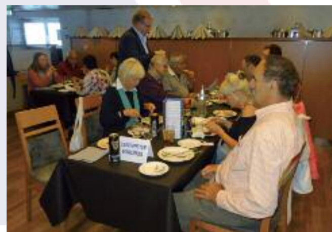
In gemütlicher Runde beim Abendessen auf der Fähre DFDS.