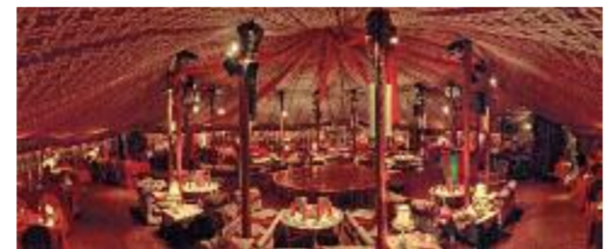
Blick in das orientalische Zelt.

einem Fest für die Sinne... Tipp: Ob Reisegruppe, Firmenjubiläum oder Kunden-Event: Madi bietet Gruppen von 30 bis 200 Personen vielfältige Möglichkeiten für außergewöhnliche Events im